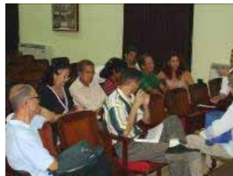
Uno de los equipos en que se dividió el plenario para reflexionar sobre la conferencia inaugural.